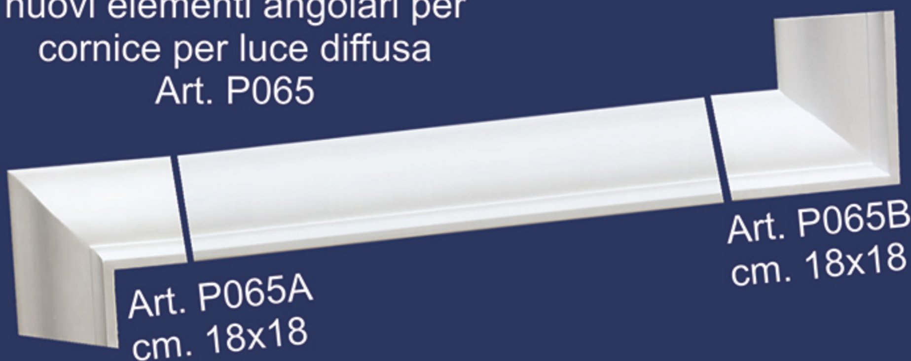
Art. P065A cm. 18x18

nuovi elementi angolari per cornice per luce diffusa Art. P065