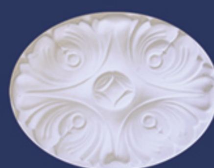
Art. DE006D cm. 15x12