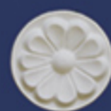
Art. B31 d. cm. 6,5