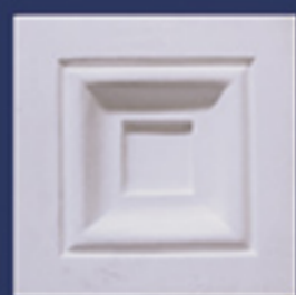
Art. B33 cm. 9,5x9,5