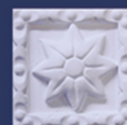
Art. B37 cm. 8x8