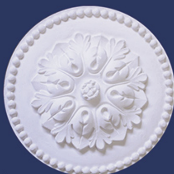
Art. RO060 d. cm. 20