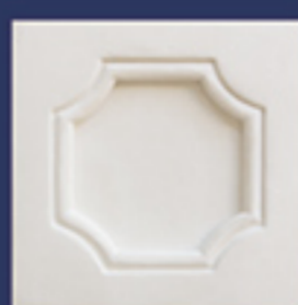
Art. B40 cm. 10x10