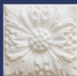
Art. B39 cm. 11x11