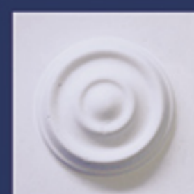
Art. B34 cm. 10x10