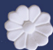
Art. B38 d. cm. 6