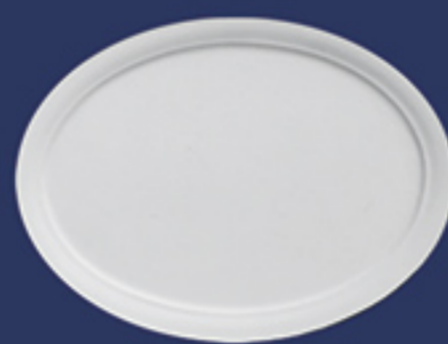
Art. DE006C cm. 15x12