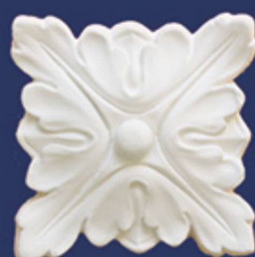
Art. DE029 cm. 14x14