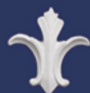
Art. DE013 cm. 8,5x8