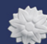
Art. B30 d. cm. 6