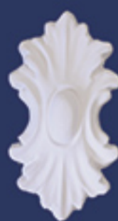
Art. DE030 cm. 12,5x7