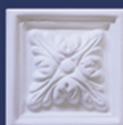
Art. B35 cm. 8x8